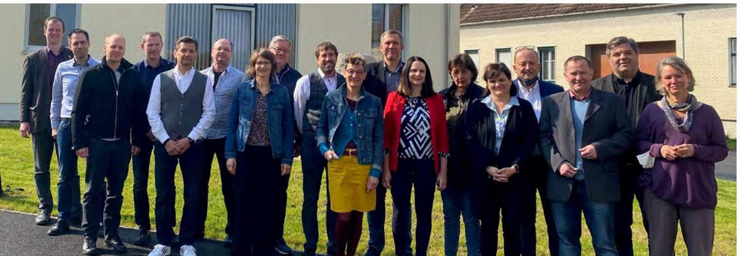
AmtsleiterInnen-Treffen in Niederhollabrunn

Besonderes Interesse löst das Pi- lotprojekt des Regionalentwick- lungsvereins 10vorWien zum The- ma „KindergartenbetreuerInnen“ aus. Dieses wird in Kürze in den Gemeinden Enzersfeld und Hagen- brunns gestartet. Ziel ist, dass sich hier die Gemeinden in Fällen von Personalausfall gegenseitig aus- helfen. Gemeindeübergreifende Zu- sammenarbeit für ähnliche Heraus- forderungen sind wichtige Impulse.